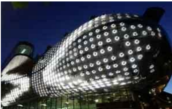
Fassadenbeleuchtung der se Lightmanagement am Kunsthhaus in Graz (A)

Für den Entwicklungsprozess wurde eine Steuergruppe eingesetzt, in der auch die zweite Führungsebene vertreten war. Es zeigte sich schnell, dass die Zusammenarbeit zwischen der GL und den diversen Bereichsleitern ein zentraler Schlüssel zum Erfolg sein würde.